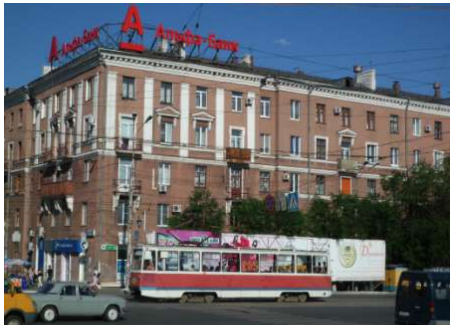
Проспект Ленина, г. Орск

Площадей, проспектов, улиц Ленина в нашей стране около 8 тысяч. Их общая протяженность примерно 8.552 километра